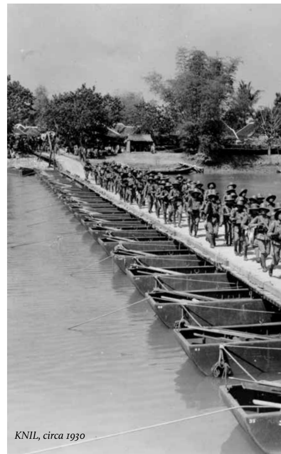
KNIL, circa 1930