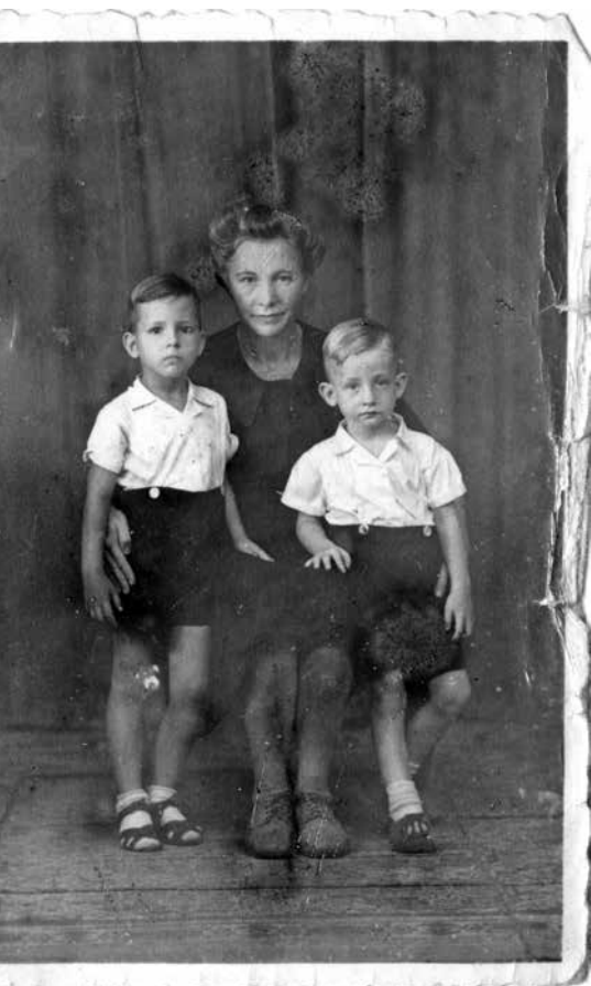
Moeder en kids 1945