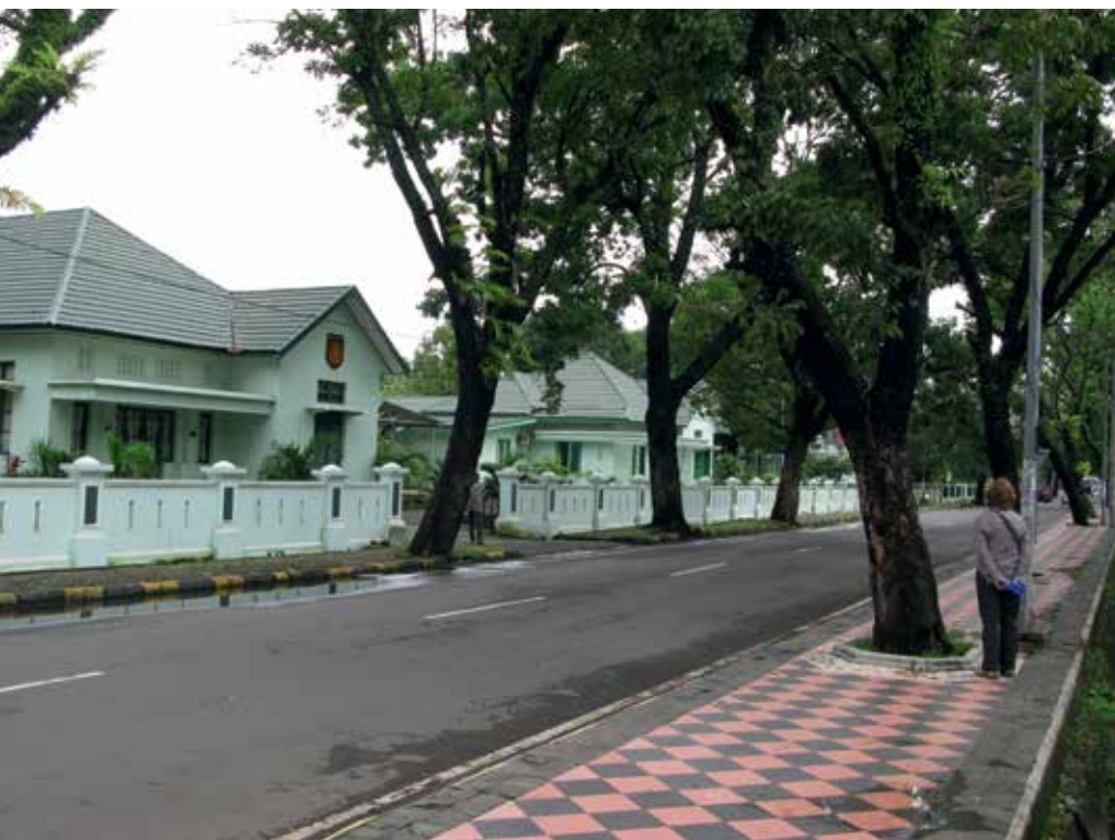
Michielselaan in Makassar

Een grote beweging, Lapris, coördineerde de 'rood-witte terreur' tegen de plaatselijke bevolking, tegen de onafhankelijke deelstaat Oost-Indonesië, tegen de Hollanders en alle anderen die het niet met hen eens waren.