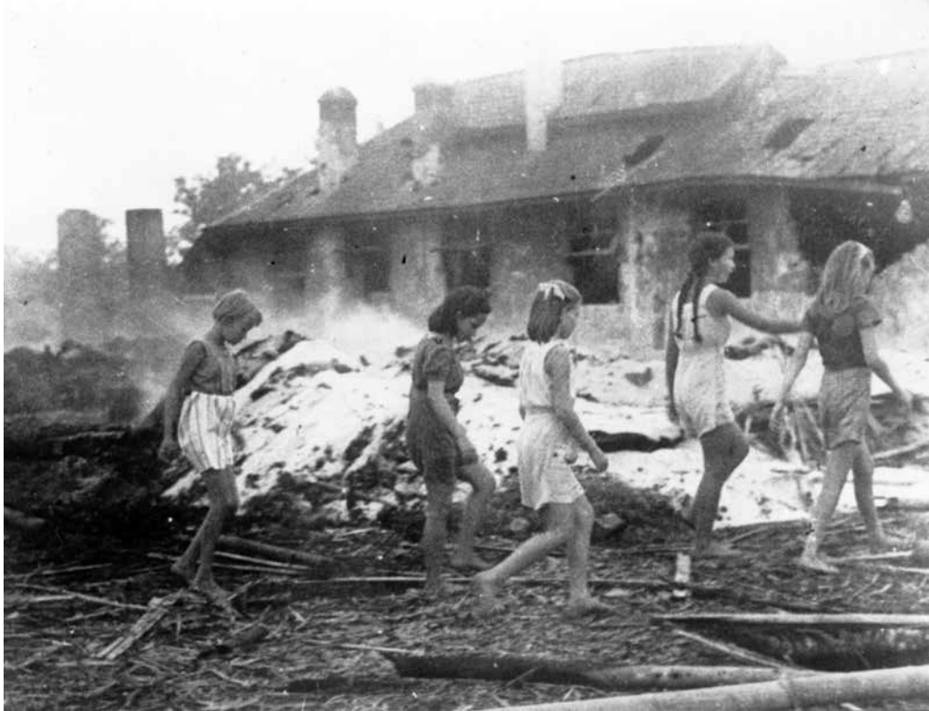
De brandbommen overleefd

In het volgende hongerkamp TanTui op Ambon werd de Japanse bommenopslag in het kamp gebombardeerd. Moeder rende met haar twee kindjes de zee in, zo diep dat ze bijna verdronk, terwijl de bomscherven het zeewater deden schuimen en bloed de zee kleurde. Op Celebes, in de keukenploeg van het slavenkamp Kampili, krabde ze de aangekoekte restjes van de kookketels om