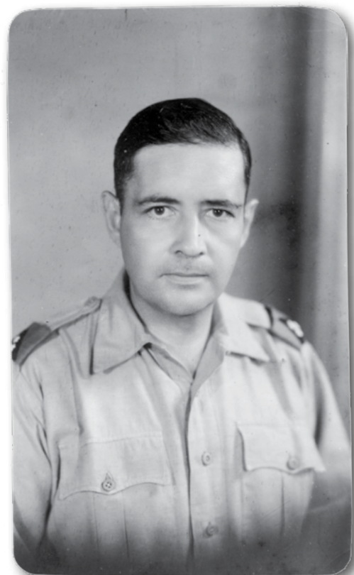
KNIL kap Han

Er kwam al een eerste KNIL-compagnie op 17 januari 1946, die 2/17 Infanterie bataljon (Australië) afloste; later kwamen er nog meer versterkingen. Eind januari werden de Australiërs vervangen door de 80ste Brits-Indische Infanteriebrigade onder