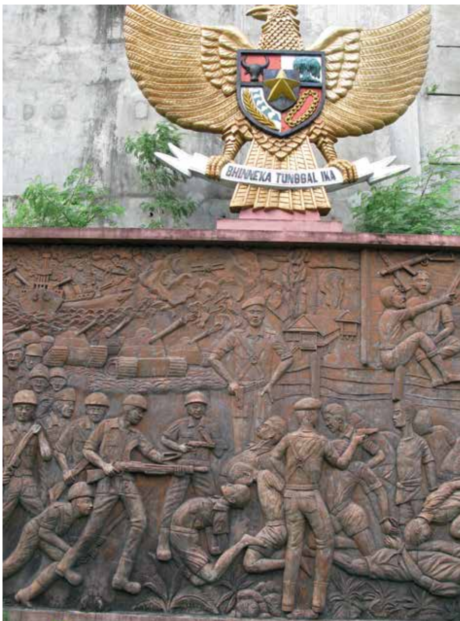
Westerling leidt slachting

Nader onderzoek onder officieren van de TRI leidt tot de conclusie dat het aantal van 40.000 zuiver fictief is en als politieke propaganda tegen de Nederlandse bezetting is gebruikt. In latere officiële onderzoeken wordt geconcludeerd dat in de periode 11 december 1946 - 3 maart 1947 bij alle acties van Westerling met zijn kleine mobiele DST - met een totale sterkte van 125 militairen en slechts uitgerust met lichte infanteriewapens - bij de tegenstander totaal 388 doden zijn gevallen. Voor het merendeel zijn dit in de strijd gedode infiltranten, het kleine aantal van standrechtelijk omgebrachte oorlogsmisdadigers, moordenaars en verkrachters is nooit exact vastgesteld. Het wordt tijd dat de echte slachtoffers van de onderwerping van Celebes door de regering van Indonesië in de periode 1950 - 1965 en hun directe nabestaanden financieel worden gecompenseerd door het huidige bewind in Djakarta.